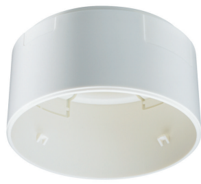
LRH1070/00 SENSR SURFACE BOX