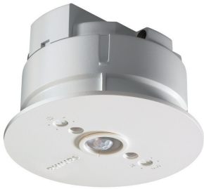
LRM1070/00 SENSR MOV DET ST