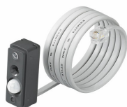
LRI1663/00 ActiLume gen2 Multi-Sensor