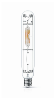
HPI-T 1000W E40